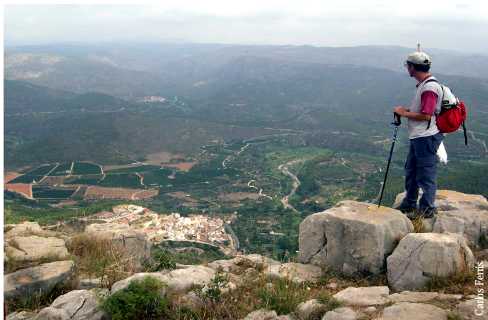
Espadilla desde la peña Saganta